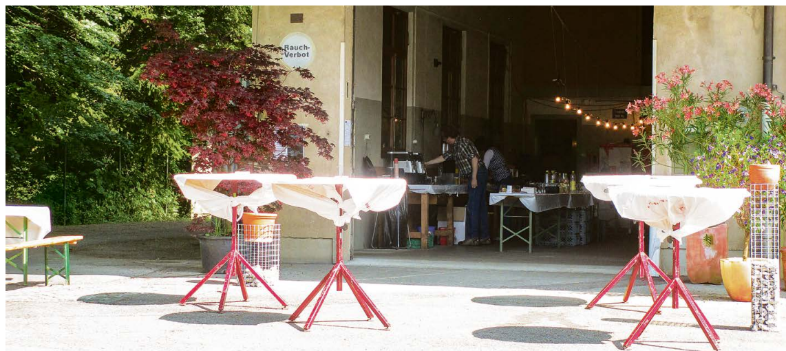
«Kultur im Zeughaus» bietet natürlich auch ein Bistro an.