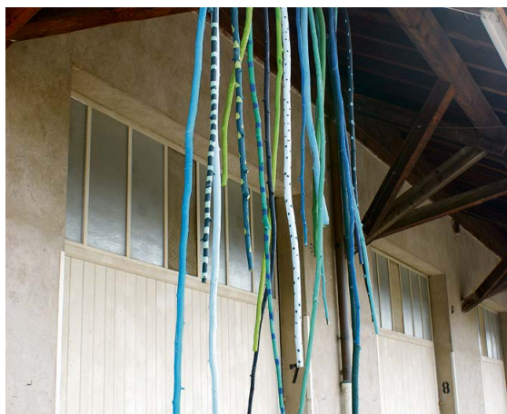
Kunst, die vom Dach kommt...